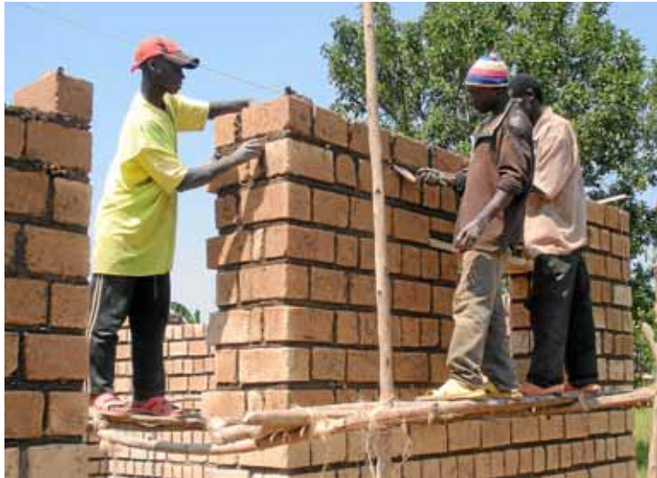
I amb l'ajuda de VSF construïren nous edificis de totxana de ciment.