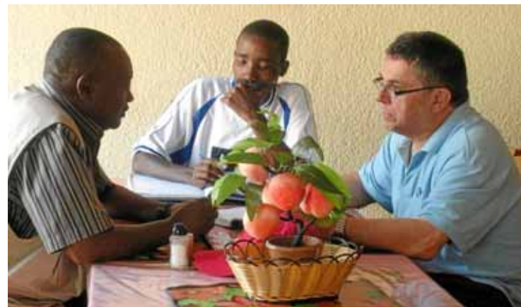
Monroig, a la dreta, amb col·laboradors d'una ONG de Burundi.

VSF ha impulsat a Tanzània un centre de criança i escorxament de conills, a més d'una embotelladora de tomàtiga en conserva