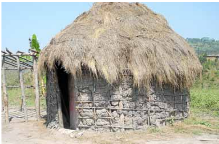
Els batua (nòmades), s'arribaren a establir a llars de Burundi.