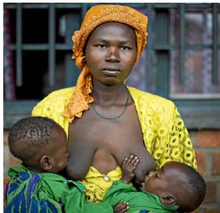
Una muller dona pit, alhora, els seus dos infants.

Per tal de garantir la transparència dels projectes de cooperació internacional finançats des de les Illes Balears, cada cop és més freqüent que les entitats o administracions enviïn un supervisor als països on s'executen. Així, cada vegada són més les persones del nostre entorn