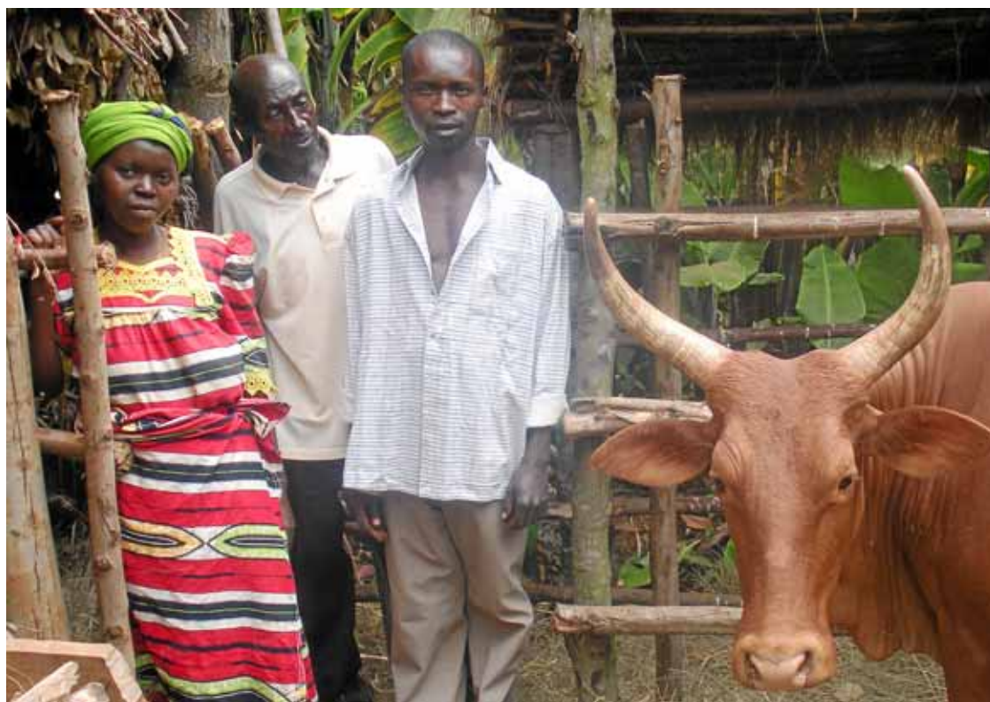
Una família de Gishora, que cultiva la tradició dels tambors, amb una de les vaques que reberen a cada llar.

construir 50 habitatges (no només de fang, sinó de ciment!). Amb aquesta activitat, a més a més, han après un ofici i ara podran fer feina de picapedrers.