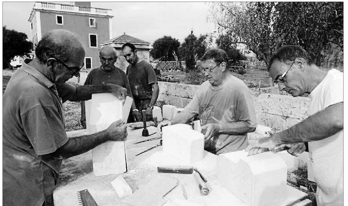
El grupo ha empezado a tallar las piezas de marès para reconstruir la antigua entrada a Sa Vinyeta.

Relatan los participantes que pese a que le han dedicado mucho tiempo a Sa Vinyeta, aún queda un gran trabajo por realizar en ese espacio. En esta ocasión cuentan con una subvención de 3.000 euros a cargo del proyecto europeo Leader. Las tareas continuarán hasta el próximo mes de mayo cada tercer domingo de mes.