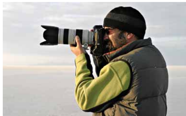
ELS FOTOPERIODISTES A la dreta, un fotògraf en acció. Arriben d'agències com Magnum, AFP, AP, Efe...