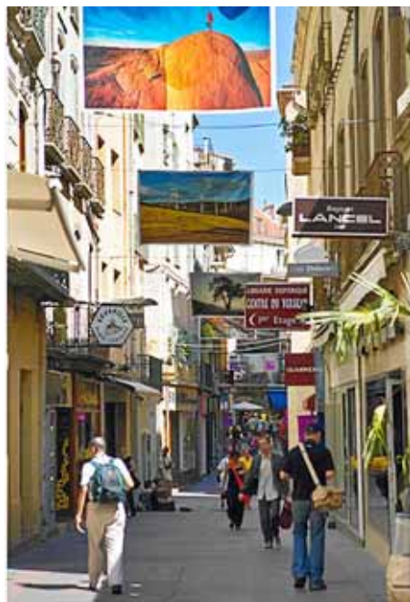
Decoració als carrers de Perpinyà.