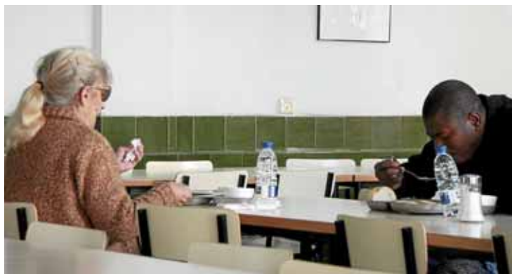
El menjador és, com mostra la imatge, multiracial i intergeneracional.

N'hi ha prou d'observar el menjador, en plena ebullició, per veure que -efectivament- la pell de color negre hi ha arrelat. I encara són més visibles gràcies a la seva companyonia. "Tendeixen a asseure's junts, tots plegats en taules allargades", expliquen al centre. Encara que no es coneuguin personalment, s'ajunten com ho farien tres euro-