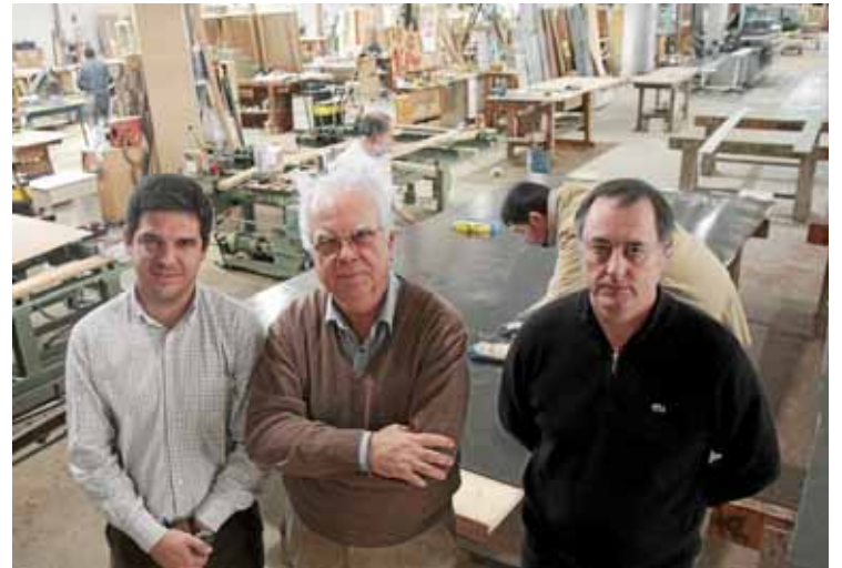
Feines a la nau de la fusteria Vicens, al polígon de Son Castelló.

L'eix social també el tenen present: un petit percentatge dels beneficis de l'empresa van a parar a projectes de desenvolupament i de cooperació. • L.L.D.