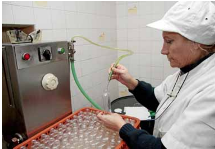
Una operària envasa gel natural al Laboratori Authex.

Els perfums i pomades que elabora Authex es fan "amb flors i plantes d'aquí, com els feien les nostres padrines quan a Mallorca