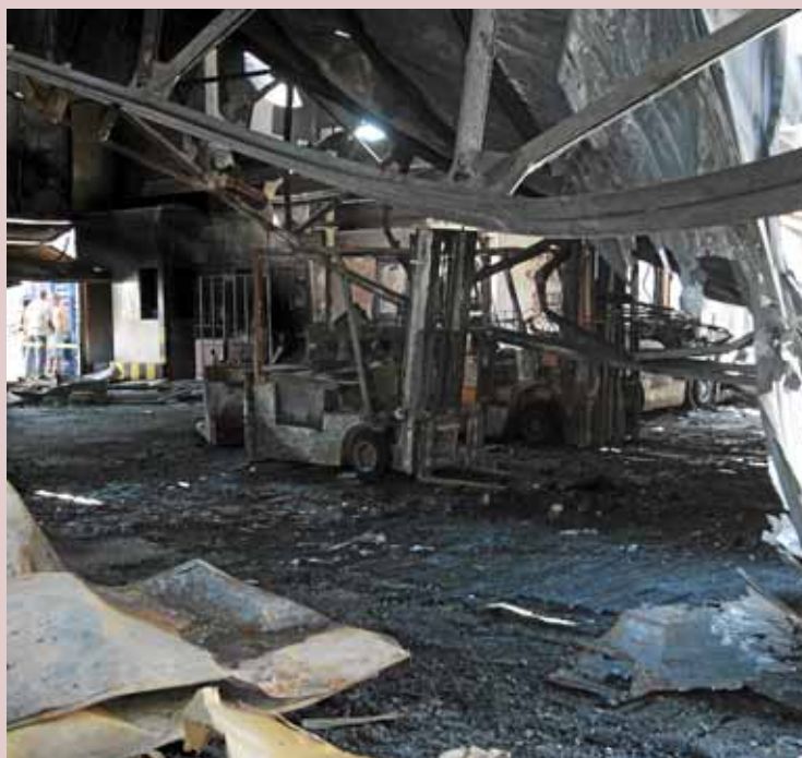
Tres naus de Mercapalma van quedar completament calcinades.

•••La matinada del passat 29 de juliol un fatídic incendi al complex comercial de Mercapalma destruï per complet el magatzem del Banc d'Aliments. En aquest succés, en què també es va veure afectada la nau de l'empresa de fruites i verdures Palma Fruit i Pescados Gimenez, l'entitat va perdre moltes tones d'aliments, a més de les cambres frigorífiques que empraven per a la seva conservació i que encara es poden veure de manera clara els efectes sobre les infraestructures afectades. Aquest incendi fou un cop molt dur per a la Fundació, però la solidaritat de les institucions, de la direcció de Mercapalma i de les empreses col·laboradores va permetre que la tasca de l'entitat no s'aturàs en cap moment. Així, en menys de 48 hores ja