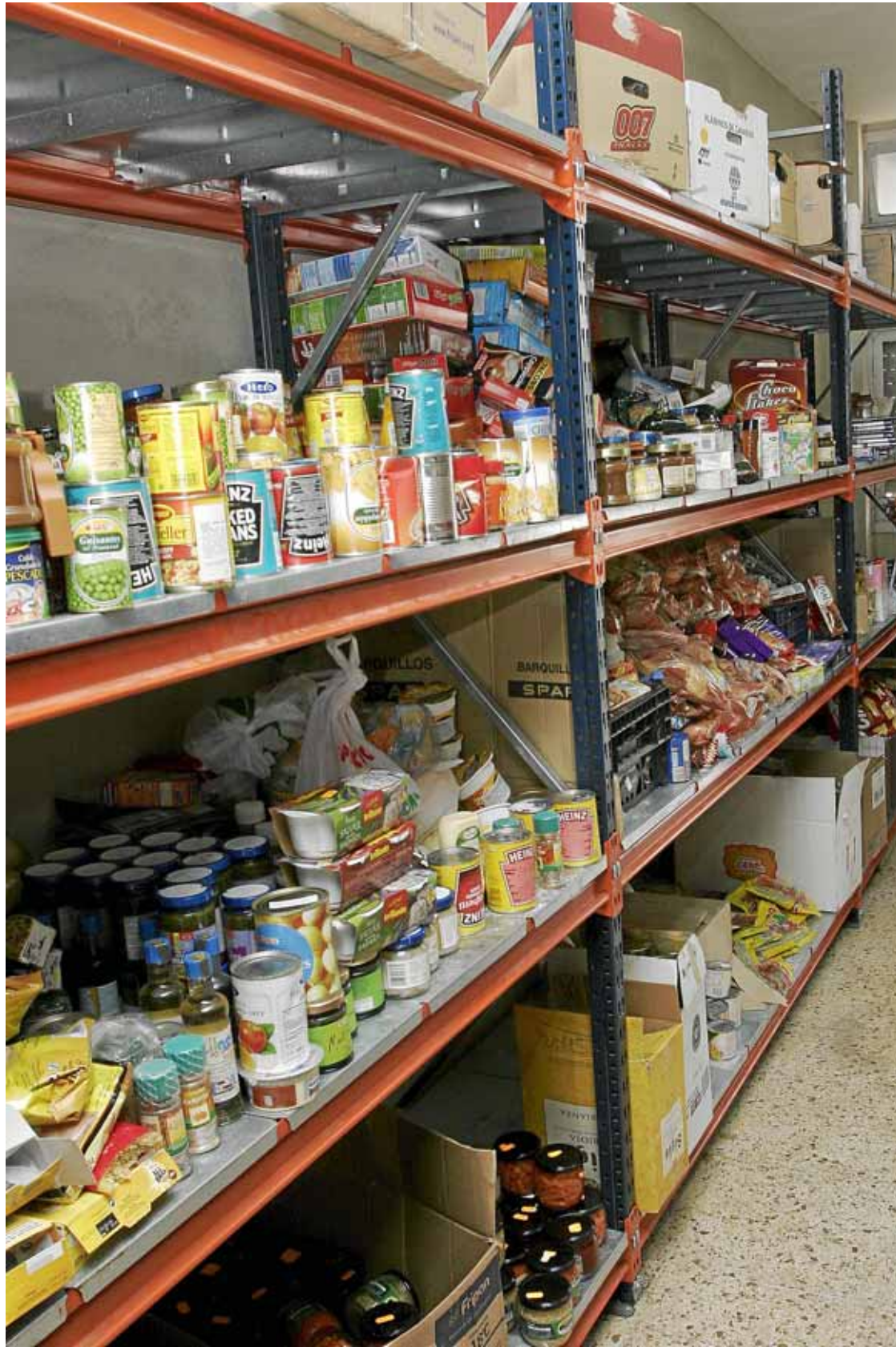
Productes excedents o amb petits problemes d'etiquetatge poden ser aprofitats per aquells que passen gana.

El Banc d'Aliments de Balears-Orde de Malta és una entitat que es dedica a recollir excedents alimentaris o amb dificultats de comercialització i a repartir-los de manera gratuïta entre les persones que no els poden adquirir. Tan sols en el 2007 l'ONG ajudà prop de 14.000 persones a les Balears