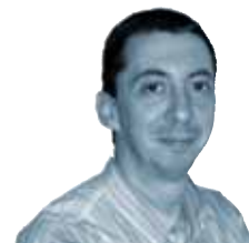
MIQUEL ÀNGEL MARIA www.miquelmaria.cat

Per ventura una de les dictadures més antigues, sanguinàries i més pobres del planeta. Than Shwe, cap de la Junta Militar de Birmània, opta per la censura i la repressió per controlar els dissidents.