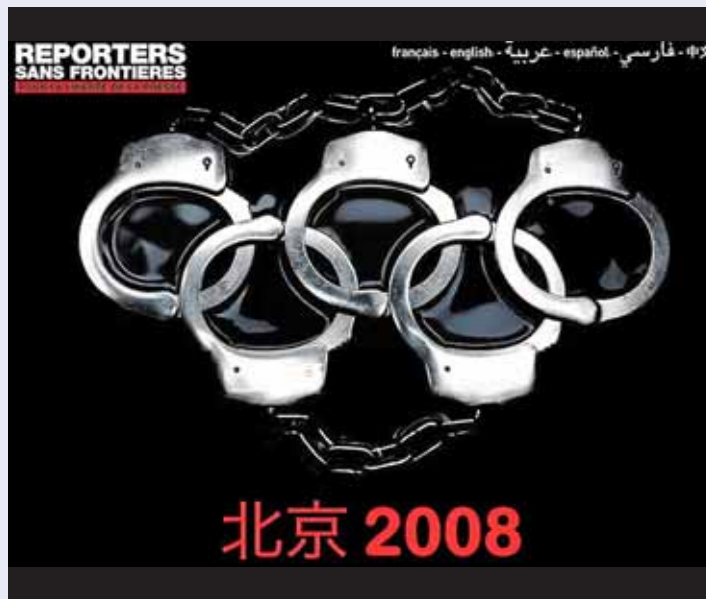
Logo de la campanya pro DH de Reporters Sense Fronteres.

... Vuit membres del grup armat palestí Setembre Negre assaltaren la residència olímpica d'Israel. Assassinaren dos atletes. La Policia alemanya tirotejà els palestins en el decurs de l'intercanvi de presoners, en què moriren nou israelians més.