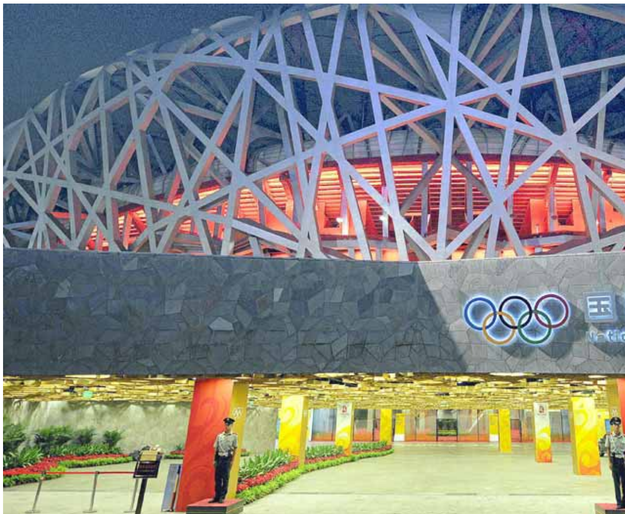
Tot és a punt per a la inauguració dels Jocs Olímpics de Pequín.

Tot i això, el que la població oriental necessita és que l'esport "catalitzi les ànsies de democràcia i de llibertat". Vet aquí el gran dilema. Ajudaran les Olimpíades a generar espais de llibertat i premsa lliure o tan sols donaran una capa