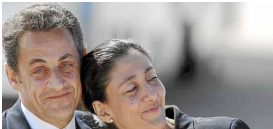
Nicolas Sarkozy rebé la setmana passada a París Ingrid Betancourt amb tots els honors.