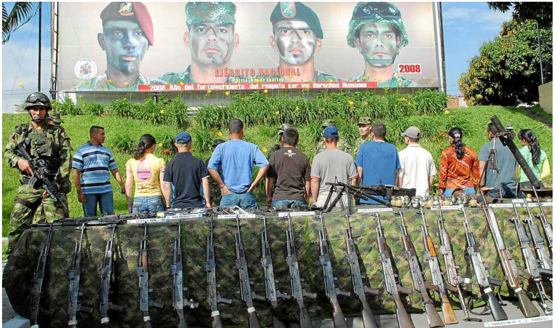
Un grup de guerrillers de les FARC lliura les armes a Medellín sota la supervisió de l'Exèrcit, a principi d'aquest mes de juny.

El conflicte bèl·lic pel poder de les terres a Colòmbia deixa cada dia al país una mitjana de 100 morts violentes. Paramilitars, les FARC i l'Exèrcit han obligat 3,1 milions de pagesos a traslladar-se a les zones urbanes. Cansats de la repressió, pobles sencers prenen la iniciativa i miren d'autogestionar-se