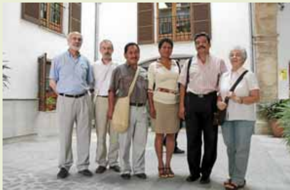
Els membres de GESI i els dirigents locals colombians.

PALMA Sis classes de pomades a base d'herbes medicinals es venen a Colòmbia gràcies a l'ONG Grup d'Estudis de Salut Integral (GESI), amb seu a Palma, i a l'Associació Camperola de Caldonó (Asocal). Es tracta d'aprofitar els remeis casolans per suplir la manca d'estructura