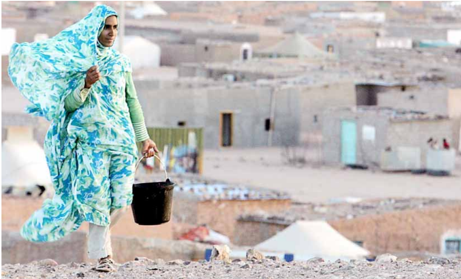
A Tindouf viuen més de 200.000 saharauis. Als territoris ocupats del Sàhara Occidental, la població autòctona no gaudeix tampoc de gaires comoditats.